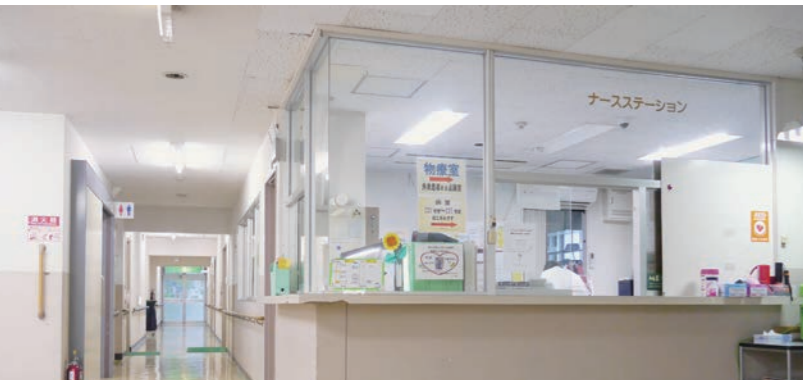
岩国市立美和病院

自治医科大学では、卒業後は出身自治体で地域医療に従事することが義務づけられています。私は山梨県出身ですが、大学で