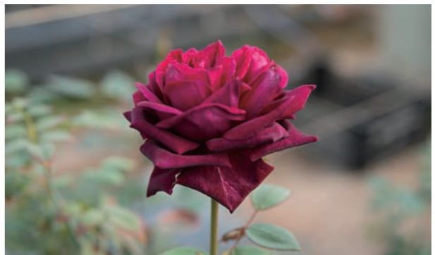
大内バラ園で栽培しているバラ