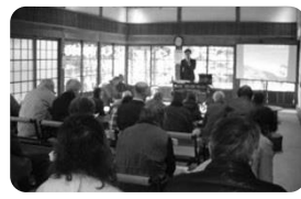
地域を学ぶ歴史講座を開催