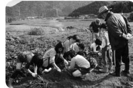
野菜づくりで地域交流