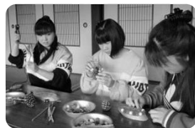
身近な素材でクラフト体験