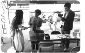
フードバンク活動啓発