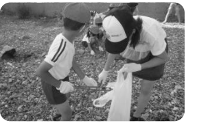
地域住民とともに海岸清掃