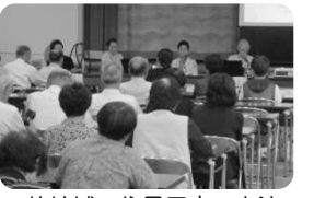
他地域の住民同士が交流