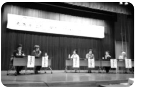
輝く女性の生き方紹介

「きらめき活動助成金」は事業に対する助成金であり、団体の運営そのものに対する助成金ではありません。