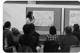
アイデア出し合いまちづくり